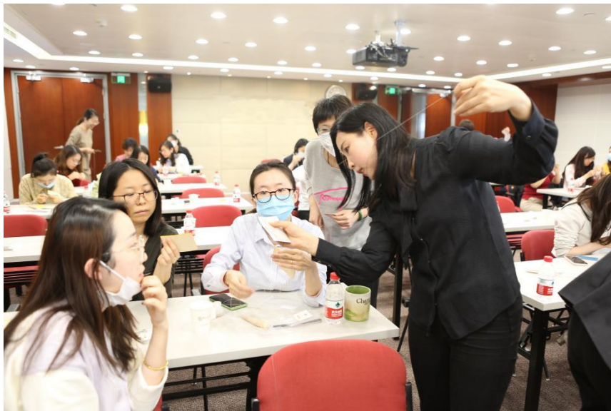
图为中银保险总公司“三八”妇女节手工皮艺体验活动现场