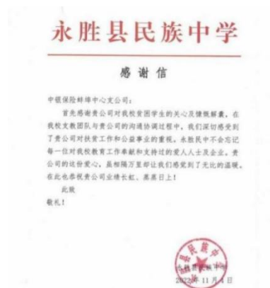
图为“一封来自大山里的感谢信”

中银保险安徽分公司蚌埠中支牢记“金融为民”初心使命，在获悉当地一些学生因家庭贫困而不得不放弃学业后，在当地保险行业发起“心系大山、扶贫助学”公益活动。组织企业爱心捐助，募集款项物资，精准扶贫永胜县民族中学学生，用实际行动践行国有金融企业责任担当。