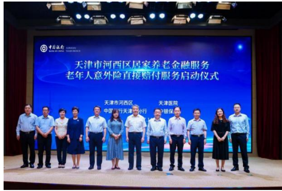
图为中银保险出席天津市河西区居家养老金融服务 老年人意外险直接赔付服务启动仪式